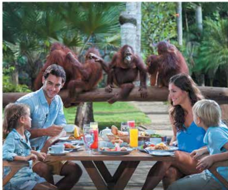
Breakfast with Orangutan