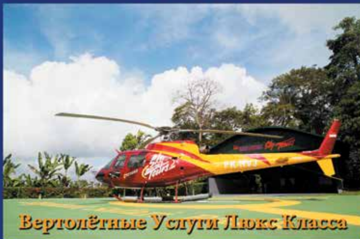
Вертолётные Услуги Люкс Класса