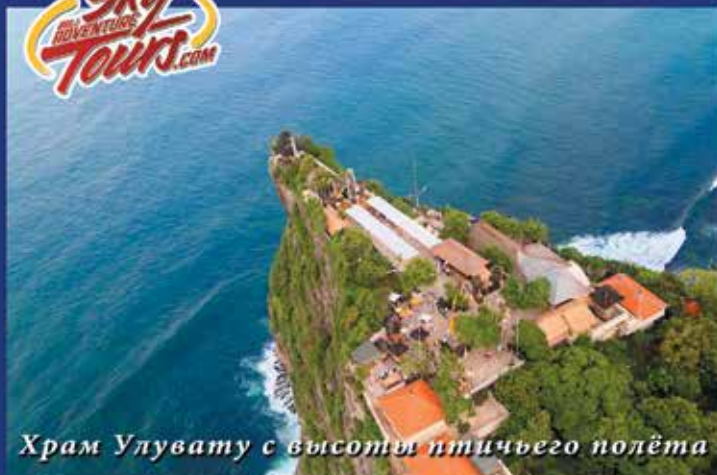
Храм Улувату с высоты птичьего полёта

«6-е место среди самых уникальных свадебных церемоний в мире»