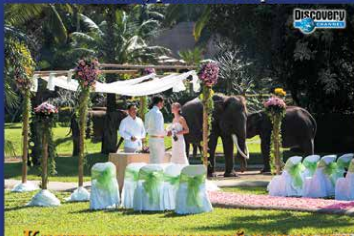
Клятва супружеской верности верхом на слоне

«6-е место среди самых уникальных свадебных церемоний в мире»